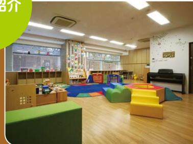
園内の様子。認可保育園と同様の面積で 広々しています。