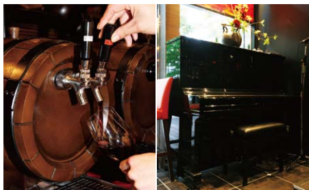
左/樽から直接注いで楽しめる樽生ワイン。ワイワイ飲むにはぴったりです。右/店内にはピアノや大型スピーカーシステムも導入。

当店はさまざまなイベントも実施しています。既存店で好評いただいている肉のオークションは不定期で開催しています。誕生日や記念日のために肉ケーキもご相談に応じて提供します。また、毎月10日にはオーバースワンが試飲でき、毎月29日にはローストビーフの食べ放題といったイベントも開催しています。これからもみなさまに楽しんでいただけるイベントを企画していきます。