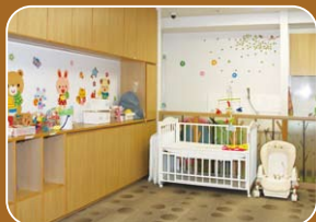
0歳児のお部屋。写真奥には沐浴できる設 備もあります。