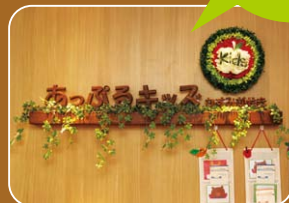
保育園名のプレート。園内の温かい雰囲気 を象徴するようなデザインです。