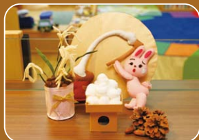
エントランスには季節ごとにハンドメイドの 作品が並びます。