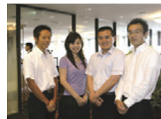
「けやき」のエントランスホールで。

取材を行ったのはちょうどお盆休み前。レストランけやきで食事を味わいながら、お休み中の計画を和気あいあいと話していました。こんな時間もOFFの時間の過ごし方のひとつですね。