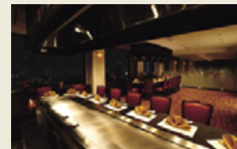
鉄板焼きでは、シェフの技を楽しみながら目の前で焼かれる旬の食材を味わえます。最大10名席が2卓あります。

本格的なフレンチダイニング、鉄板焼きカウンターを備えたレストランです。店内はけやきをイメージした落ち着いた空間。食事とともに地上125mからの眺望も満喫できます。