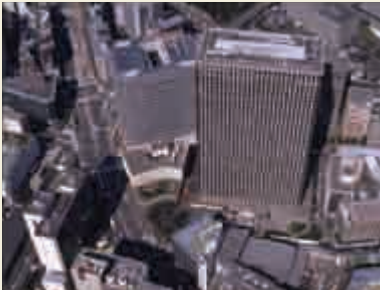
1989年当時の霞が関ビル