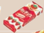
1975年 ハイチュウ (ストロベリー) (森永製菓)