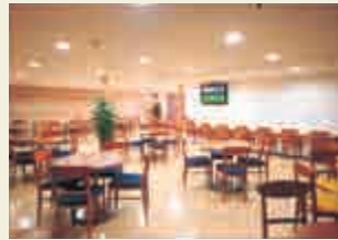
ロビー階にオープンしたリエゾンプラザ(2001年)