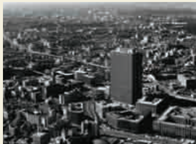
当時の都心の様子(1968年)