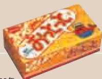
1982年 おとっと(森永製菓)