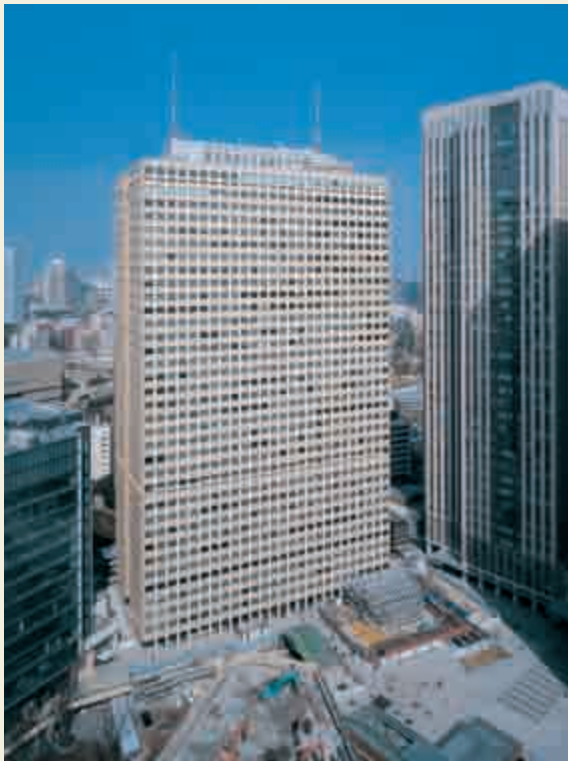
工事が進む霞が関ビルと周辺(2008年3月)