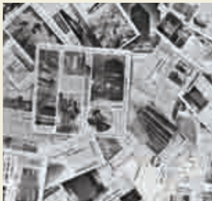
当時の新聞記事。 日本初の超高層ビルとして注目を集めました