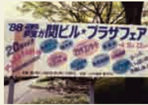
20周年霞が関ビルプラザフェア (1988年)