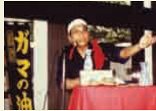
ユニークな口上が人気を集めた大江戸大道芸