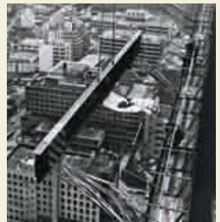
高々と上げられていくH型鋼のはり(上様式)