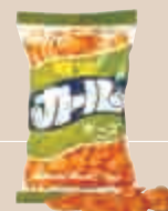
1968年 カール(チーズ味) (明治製菓)