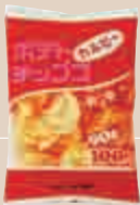
1975年 ポテトチップス (カルビー)

霞が関ビルが誕生した頃から現在までの 人気のお菓子をピックアップしました。 きっと大好きなお菓子が見つかるはず。