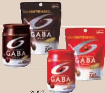
2005年 メンタルバランスチョコレート GABA(グリコ)