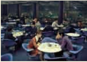
モダンなインテリアの霞が関東京會館(1968年)