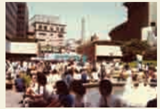
噴水広場でつろぐみなさん