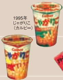
1995年 ジャガリコ (カルビー)