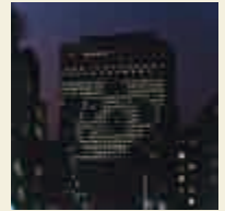
パンダのトントン (1986年)