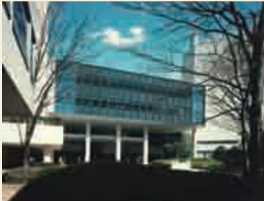
仮転用オフィス (1991年)

1989年からは、オフィスフロアの大規模改修を実施しました。OAフロアや光ファイバーの敷設など、オフィスのIT化をいち早く実現。工事期間は、敷地内に仮設オフィスをつくり、フロアや会社単位で、移動していただき、工事終了後、新しくなったオフィスに戻っていただきました。