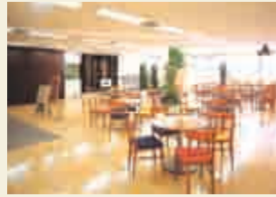
3階にオープンしたKiraku霞が関とリエゾンプラザ(2004年)