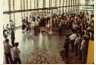
36アップアップマラソン