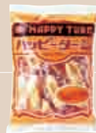
1976年 ハッピーターン (亀田製菓)