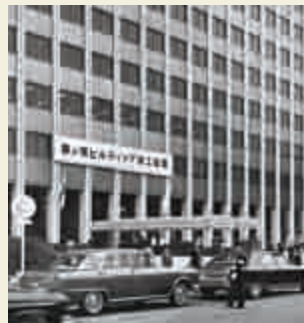
霞が関ビル竣工のお披露目(1968年)