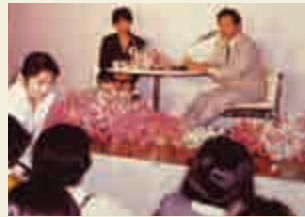
オープン20周年記念「レディスセミナー」