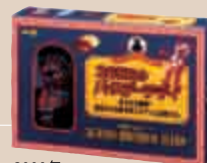
2000年 365日のバースデー (明治製菓)