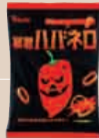
2003年 暴君ハバネロ(東ハト)