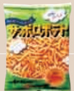
1972年 サッポロポテト(カルビー)