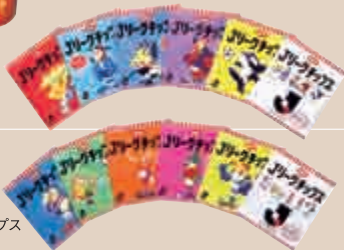
1992年 ジリーグチップス (カルビー)