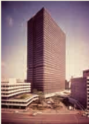
1968年完成直後の霞が関ビル

地上36階、高さ147m。 霞が関ビルは1965年3月の着工から 33か月という短工期で完成。 今では、高層ビルは珍しくありませんが、 当時の日本は9階建てのビルが一番高いビルでした。 2001年にはNHKの『プロジェクトX』で 「霞が関ビル 超高層への果てなき闘い」 という番組が放映され、 ビル建設のエピソードが語られました。