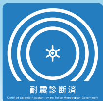
東京都交付の耐震マーク

霞が関ビルは、日本初の超高層ビルであったため、建設当時「特別な大臣認可」を取得しました。現時点においても、新耐震基準と同等クラスの耐震性能を確保しております。