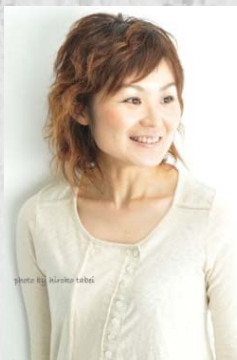
吉澤有香 (ソプラノ)