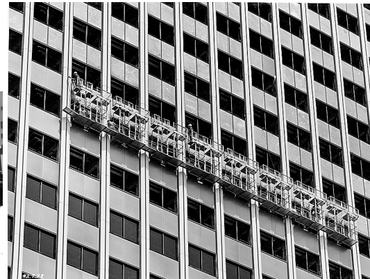
左：施工中の「霞が関ビルディング」を新橋より見る。1967年撮影。中上：施工の様子。中下：上棟式の様子。右上：工場での鉄骨組み立ての様子。右下：外壁施工の様子。